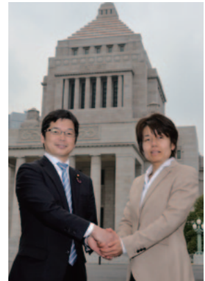
7月の第23回参院選に臨む「吉川さおり」議員と握手